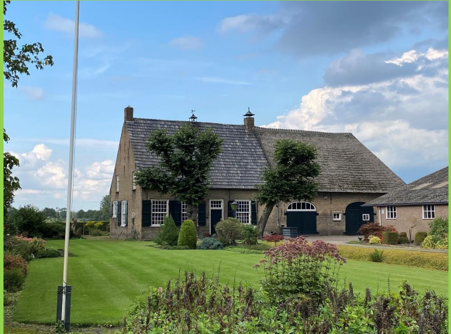
Verstoep in Markdal: Hoeve Bos uit 1861 Prachtig gemeentelijk monument in Galder

verdwenen soorten zal voor hem de echte beloning van zestig jaar vogelbescherming zijn! Waar iedereen dan van geniet.