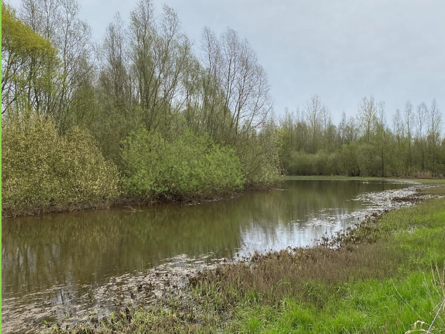
Alles kleurt in vijftig tinten groen, bij Trippelerberg

Het regende in januari en februari 2023 erg veel en vele dagen lang. Op 1 februari was het 70 jaar geleden dat de grote watersnoodramp zich voltrok, hoofdzakelijk in Zeeland en een stuk in Brabant en Zuid Holland. Met een groot aantal slachtoffers; door verdrinking overleefden 1836 personen de ramp niet, ook tien