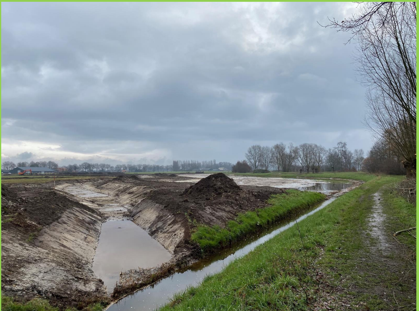
Graafwerk voor meanders Gilzerwouwerbeek bij Bavel-oost