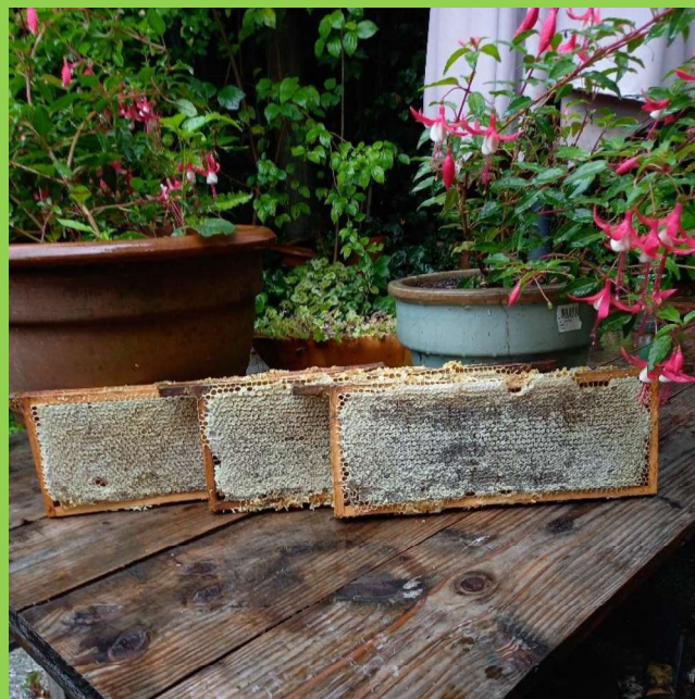
Door de bijen verzegelde honingraat.

Een aardige tip en een goede daad om nu alvast wat bollen, knollen en krokussen te planten, want als de bij de krokus kust, komt de lente weer in het land. Mocht U het wat grootser aan willen pakken, plant dan een boom of struik. Ook boomkwekers passen hun soorten al aan aan het veranderende klimaat, ook zij zijn adaptief. Zo is er ook een Oosterhoutse boomkweker, die al Mongoolse