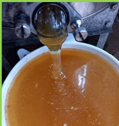
Resultaat: geslingerde honing.

linden op voorraad heeft, de Tilia mongolica buda , die goed droogte kan verdragen. Denk er eens over na, en wees op Uw eigen manier ook adaptief. Verder zou een arboretum, in mijn geval Oosterhout, maar ook elders, een aardig idee zijn met veel soorten bomen, in een grote verscheidenheid, want voor een goede ziel is het vaderland - moederland de gehele wereld, en bovendien wekt diversiteit nieuwsgierigheid op voor Jan en Alleman.