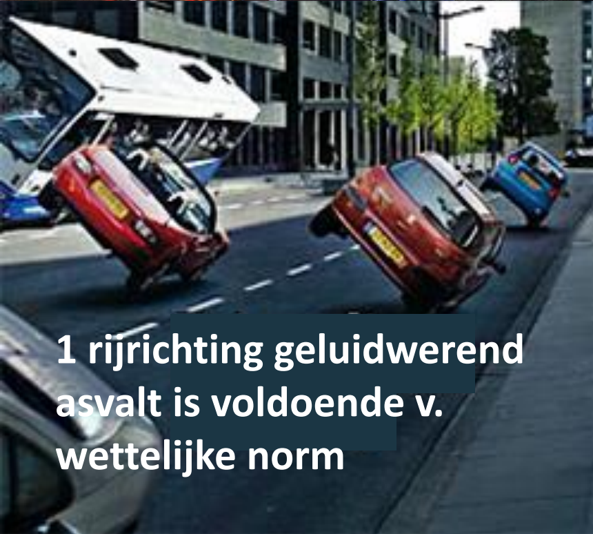
1 rijrichting geluidwerend asfalt is voldoende v. wettelijke norm