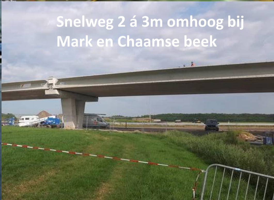
Snelweg 2 á 3m omhoog bij Mark en Chaamse beek