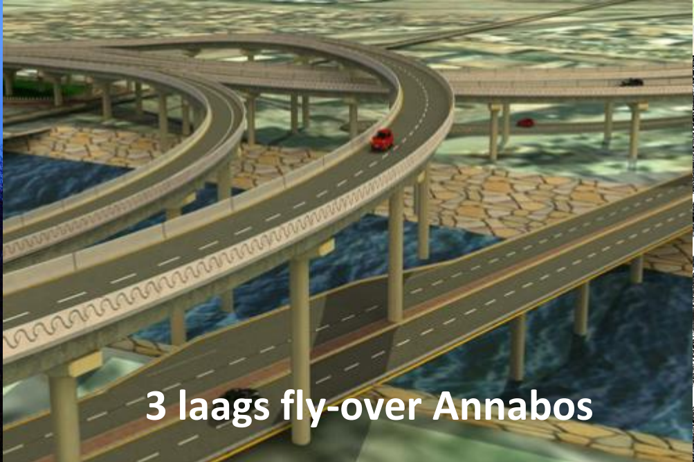
3 laags fly-over Annabos