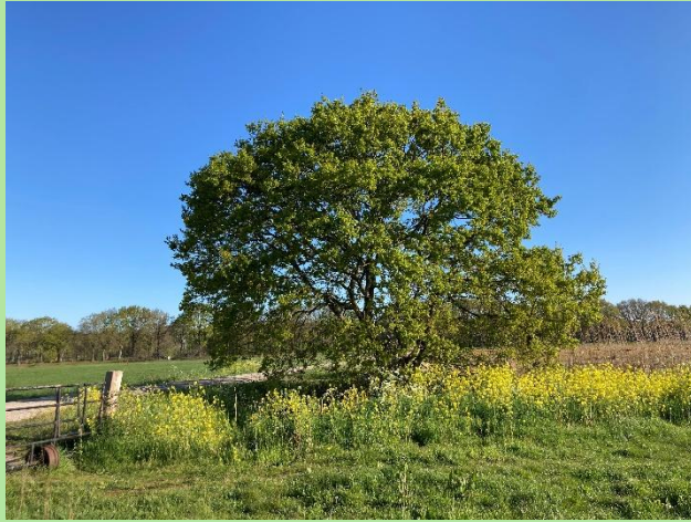
Inheemse zomereik, noordrand Lage Vucht Polder.