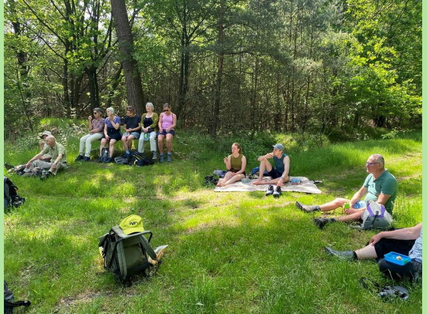
Lommerrijke Landschapswandeling met 'Hitte Plan' in Chaamse Bossen

Ik hoorde eind april voor het eerst de koekoek in natuurgebied Wouwerbeek in Bavel. De roep van de koekoek kent iedereen van deze bijzondere en wat schuwe vogel. Maar ik heb hem niet gezien; ik hoop hem alsnog te spotten. In deze periode was het al erg warm en flinke rukwinden en met ruim 25 graden daardoor