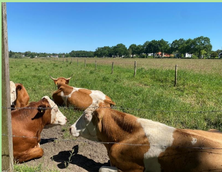
Nieuwe waarneming. oost Vlaamse Wit-Rode runderen. Markdal staat er gekleurd op!

vervuilingen zeer onwaarschijnlijk dat Brabant eind 2027 kan voldoen aan strengere regelgeving.