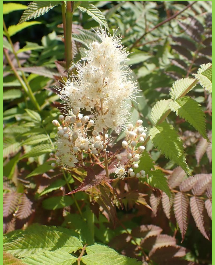
Lijsterbes (struik) Spirea.

Er is in Nederland nog een familielid en dat is de harige sorbaria ( Sorbaria tomentosa ) afkomstig uit de Himalaya