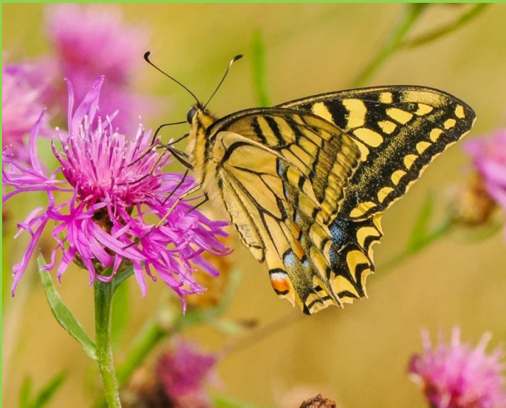
Een pareltje van een Koninginnepage op de Bleeke Heide.

en is meer een rotsplant. Deze komt veel minder voor en is verwilderd slechts viermaal aangetroffen. De geslachtsnaam 'Sorbaria' komt van een Latijns woord voor roodachtig en heeft betrekking op de kleur van de bessen. De letterlijke vertaling van Sorbaria sorbifolia is: 'lijsterbesachtige met lijsterbesblad'. 'Tomentosa' betekent 'viltig behaard'.