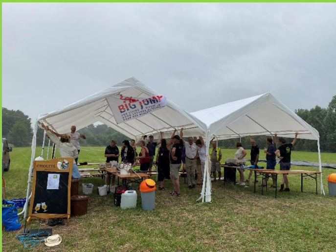
Big Jump tent doorstaat Code Oranje

doet de plant wat grasachtig aan, als je op de bladeren let. Bij twijfel kun je meteen zekerheid krijgen doordat er bij bladbreuk wit melksap uit de wond vloeit, dan is het geen gras. De plant bloeit alleen in de morgen zoals zijn naam al zegt. Wanneer de luchtvochtigheid hoog en de lucht betrokken blijft en de temperatuur toch aangenaam is, kan de morgenster tot in de middag bloeien. Bij zonneschijn sluiten de bloemen om 11 á 12 uur. De volgende morgen gaan ze op nieuw open en ook de daarop volgende soms nog een keer, maar in de regel zijn er dan al zoveel begerige insecten geweest, dat de bestuiving heeft plaats gehad. Een paar weken later zie je de eerste bolstaande vruchtpluizen al aan de planten. De lange bleekgele vruchten worden met behulp van hun parachute naar elders vervoerd. Meestal is de morgenster niet overblijvend. Toch ziet men op dezelfde groeiplaats het