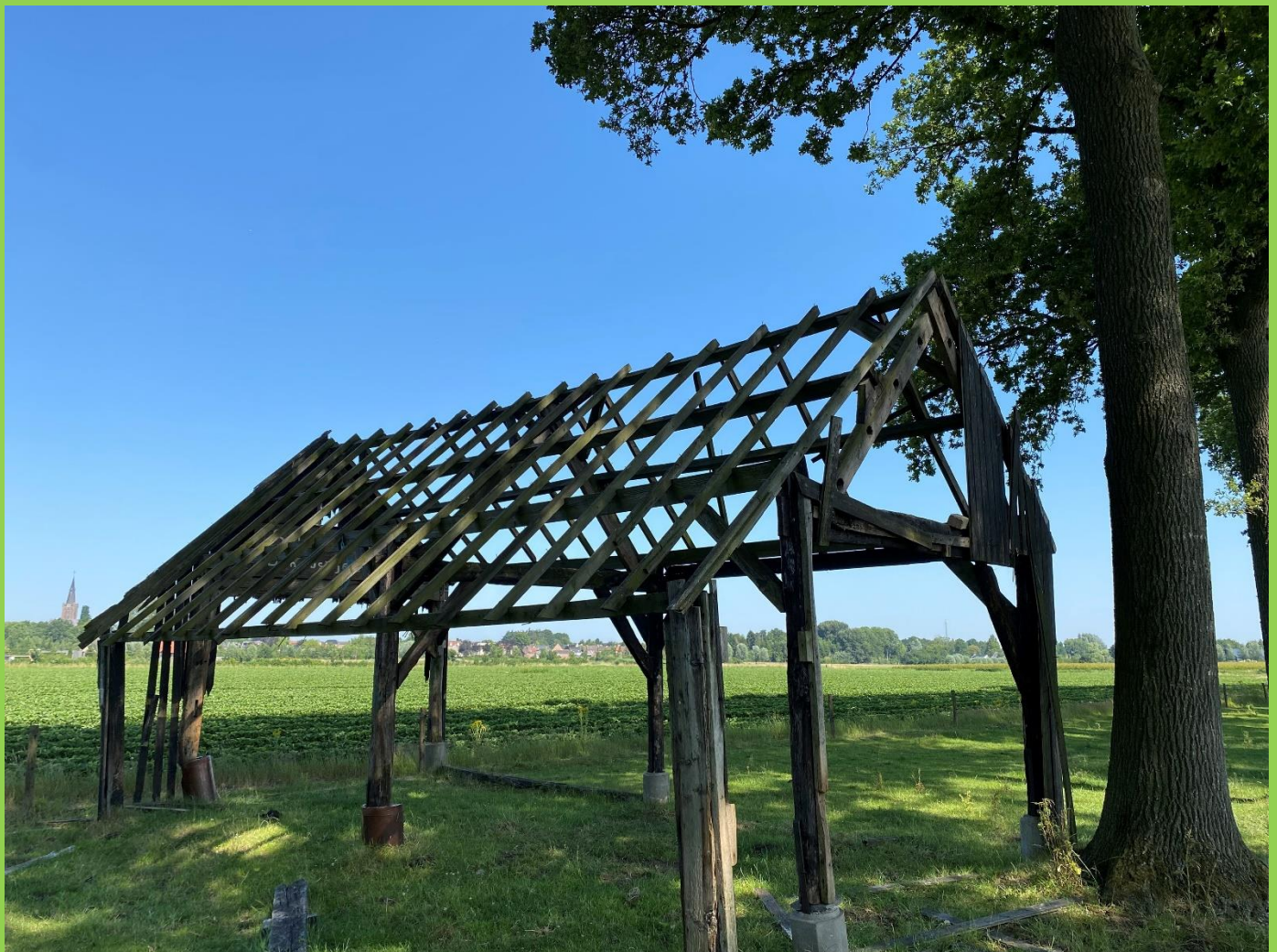
Pareltje in landschap. Verscholen oud Gebint met onbekende historie een toekomstig monument?